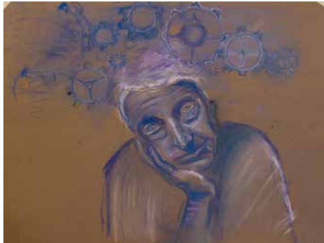
Arto Uljas ehk masendunud mees, kelle „hammasrattad logisevad“. Joonistas Aleksander Aare.