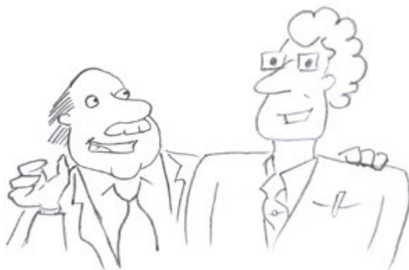
Господин Ребане и представитель ТОО Вирумаа Ластелагрид до заседания