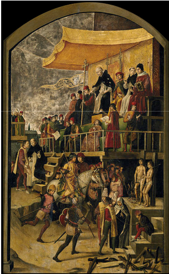
Inquisitio Haereticae Pravitatis Sanctum Officium (13. saj.)